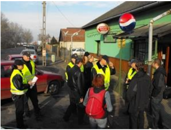
Védik az új "tisztos" tulajdonost

A rendőrök közül többen is elmondták, hogy emberi meggyőződésük ellenére hajtják végre a parancsot, hiszen tisztában vannak azzal, hogy embertelen eljárás eszközeként használják ki őket.