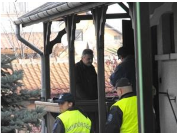
Az ő háza, az ő vára, az ő rendőrsége